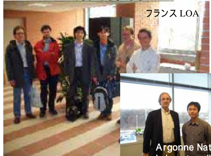
Argonne National Laboratory(USA)