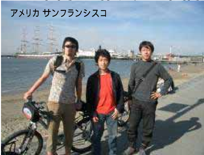
アメリカ サンフランシスコ