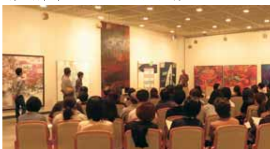
第4回 Gg展ギャラリートーク