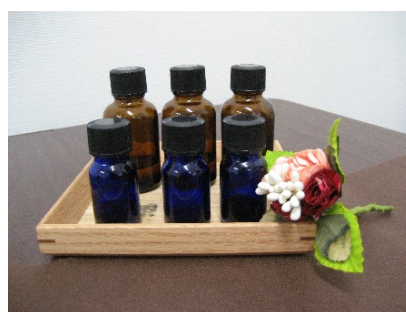
▲3 種類のアロマオイルをお持ちいただきました