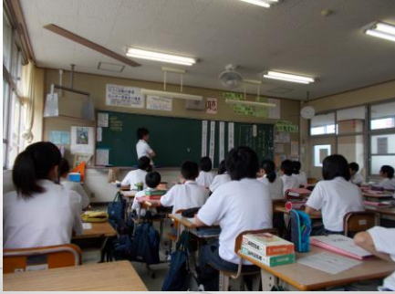
【「ドラえもん短歌」を使った短歌の創作（中2：初任者研究授業）】