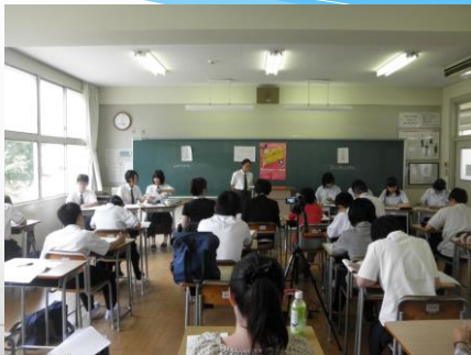
【中国・四国地区中学・高校ディベート選手権（ディベート甲子園）の様子】