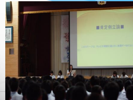
【城南中学校文化祭でのディベート発表の様子】