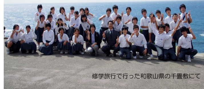
修学旅行で行った和歌山県の千畳敷にて