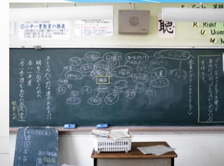
ブレインストーミングを使った詩の一連創作(中2)