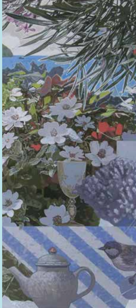
水彩画講座講師作品／高地秀明《花の詩I》(部分)