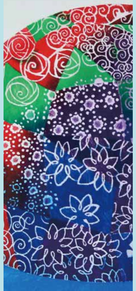
エッチング講座講師作品／岡村勇佑《鳥ひとつD》(部分)