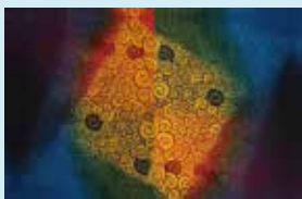
講師作品 岡村勇佑 《音連れの庭からー誕生》

会場：工芸版画室 時間：14時30分～17時30分 定員：10人 受講料：15,000円 ※一部材料費含む ※道具は各自準備