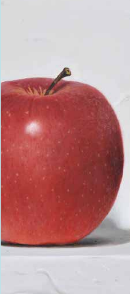
油彩画講座講師作品／上西竜二《KING》(部分)