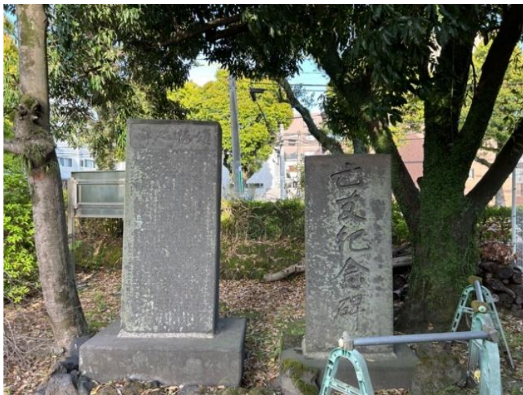
図 2: 「頌徳之碑」と「亡友記念碑」