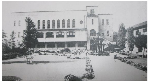
新講堂「栄光館」（『金城学院百年史』より）

このような状態だったので、教職員と生徒たちは「主よ、新講堂を与え給え」と祈り、1930年、新講堂建築の準備に入った。県の指導で次々と隣接地を買収し、生徒たちは1928年ごろから各自の小遣い銭を節約し、毎月10銭ずつ積み立て、9年間で