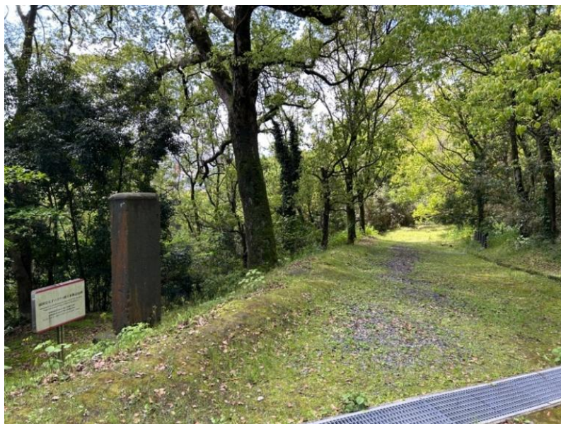
図 4 旧所在地の様子

急な坂道を登り、かつて石碑が立っていた場所をじっさいに見てきたが、ほとんど立ち入る人もなく寂れた雰囲気であった。