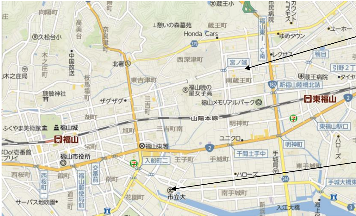
研究発表会場と懇親会会場の地図