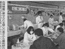
血中薬濃度を定期的に測定し、その結果に基づいて処方量を調整する「マイクロTDM」の活用状況(広島県)

「薬剤師の独立戦争」 新たなステージに向けた 薬剤師の活動は、これまで以上に多岐にわたる。特に、患者の個別化医療を実現するための取り組みが、注目を集めている。