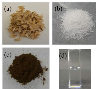
図 1. (a)もみ殻, (b)SiO 2 粉末, (c)Si粉末, (d)トルエン分散の SiQDs 溶液

図 3 に Si 量子ドットの発光している写真とスペクトルを示す (現在、論文投稿中につき、公開後に掲載予定)。これらの結果から、オレンジ発光する Si 量子ドットの合成がみてとれる。中段には二次元のスペクトルで、横軸に発光波長、縦軸に励起波長である。水素終端と炭化水素終端でスペクトル形状が励起スペクトル側で変わることがわかる。これは表面修飾による歪の効果と帰属された。切り出したスペクトルを下段に示す。また、合成した SiQD を電子顕微鏡で観察したところ、サイズが 2-5 nm に分布していた。