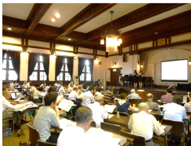
昨年の様子(基調講演)

講演者・研究発表者やタイムスケジュールなどの詳細は、随時お知らせいたします(記念館HPにも掲載予定)。教育や学生文化などに関心のある多様な職種・世代が集まるので、貴重な交流の機会になるイベントです。初めての方もお気軽にご参加いただけますので、ぜひご来場をお待ちしております。