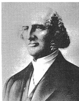
アイザック・フェリス

アイザック・フェリスは改革派外国伝道協会の初代主事で、幕末、早くもブラウン、フルベッキ、シモンズの3宣教師を日本に送り、またインド、中国の宣教にも尽した。のちにニューヨーク大学の総長になった人である。いわば日本の基督教大学設置の先達であった。キダーがジョン・フェリスだけでなくアイザック・フェリスも含めてフェリス・セミナリーと命名したのは一箇の女学校だけでなく、日本の基督教学校設置を記念する意味を持たせたのである。