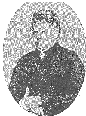
ミス・ヤングマン

ヘボンをはじめ、カロザースが来日した当時、この人物に相当の期待をかけていたが、次第にカロザースの独善と頑固さに頭を痛めるようになった。明治8年4月、彼は選ばれて東京における長老派教会の会頭になったが「耶蘇」の呼称について“イエス”ではなく“ヤソ”とせよと執拗に主張した。「耶蘇」はキリスト教禁教時代、日本人が話す侮蔑の言葉で嫌悪感がある。西洋人は本来の発音からしても“イエス”としたかった。しかるにカロザースは日本人が長くそう呼んでいるとして、“ヤソ”にこだわり固執し続け、容れられないと知るや会頭を止めてしまった。一呼称についてすらこの頑固さで、