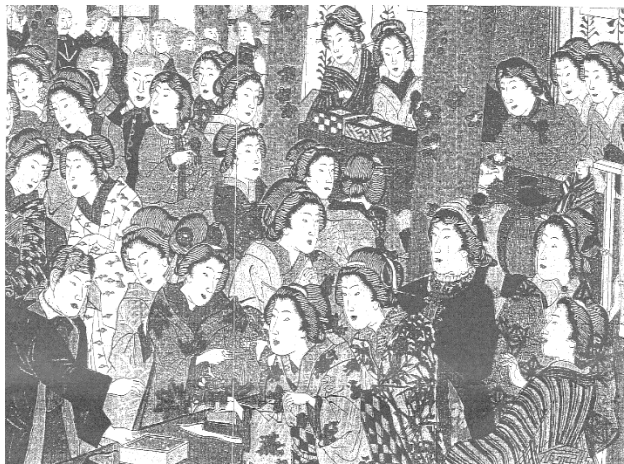
図 C 明治 17 年 6 鹿鳴館のバザー。和服が多い。

夫人及び令嬢によって行われたものであるが、殆んど和服である。舞踏会ではその性格上、洋装でなければ始まらないが、バザーではその必要がない。着慣れた和服で出席したのであろう。軽装とされたパッサルドレ