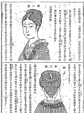
図 D 村野徳三郎「洋式婦人束髪法」(明治18年)の一部

洋装はさて置き、新しい女性の多くが飛びついたのが束髪である。洋装で旧来の日本髪では似合わない。あれほど大きな髪を頭に載せては活発に動けない。そもそも女性の大きな髪型は封建時代のものである。レイ王朝時代の王妃達も皇帝の冠 かんむり の向うを張って、髪を高く結ばせた。日本とて変らない。武家の妃たちも大名の烏帽子に合わせて高く結う。明治の宮中でも明治15年頃までは同様であった。しかし鹿鳴館で舞踏会