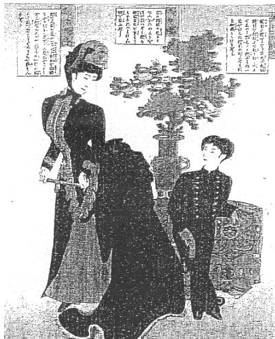
図 B パッスルドレス

19年になると宮中の女官たちが洋装化し、20年には洋装奨励の皇后思召が出され、華族女学校での洋服着用が義務付けられるなど、上流階級での洋装が進んだかにみえるが、これは表面上のことで、実はこの時代の女性洋装はそれほど拡まらなかった。図Cを見られたい。この絵は明治17年6月某日に鹿鳴館で行われた上流夫人によるバザーの会である。伊藤博文夫人をはじめ閣僚級の