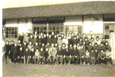
図2 宮島小学校卒業写真

多くの学校が所蔵している学校資料として“集合写真”が挙げられる。学校によって場所は異なるが、校長室や応接室、玄関などに掲示されていることが多い。一般的には、入学式(図1)や卒業式(図2)、修学旅行などの式典や行事に撮影されることが多く、卒業アルバムなどに掲載されることが多い。