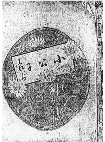
『小公子』の表紙 (明治30年1月、 博文館)