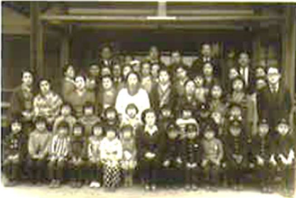
図1 宮島小学校入学写真 (出典)『学校のあゆみ美山地区編』