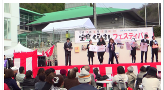
留学生インターン「倉橋フェスティバル」ステージ紹介