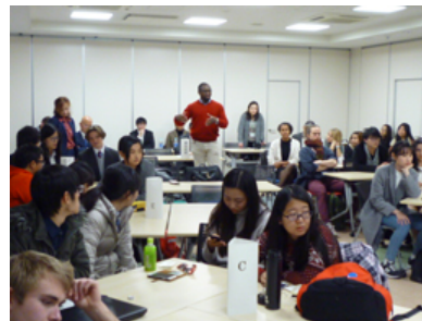
発表へのフィードバックを聞くHUSA交換留学生

発表会は、地域公開として開催され、地域企業や市議会からも参加を得るとともに、学内の教員・大学院生からも貴重なフィードバックをいただきました。企画を意義あるものにするための貴重な示唆を得るとともに、厳しい審査もしていただくことができました。