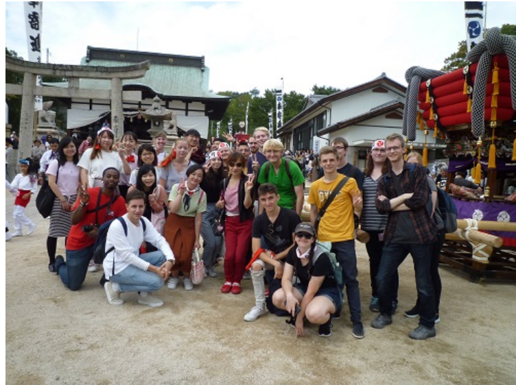
日本の地域に残る伝統的祭りの雰囲気を経験

地域の皆さまも世界各国の留学生が日本の伝統的祭りを楽しみつつ、日本文化について学ぶ姿を暖かく見守ってくださっています。HUSA交換留学生がバスをおりると、毎年のように「ばくろう」が待っていました。そして、地域の皆さまが用意してくださった鉢巻をつけ、日本の伝統的祭りを満喫する一日となりました。