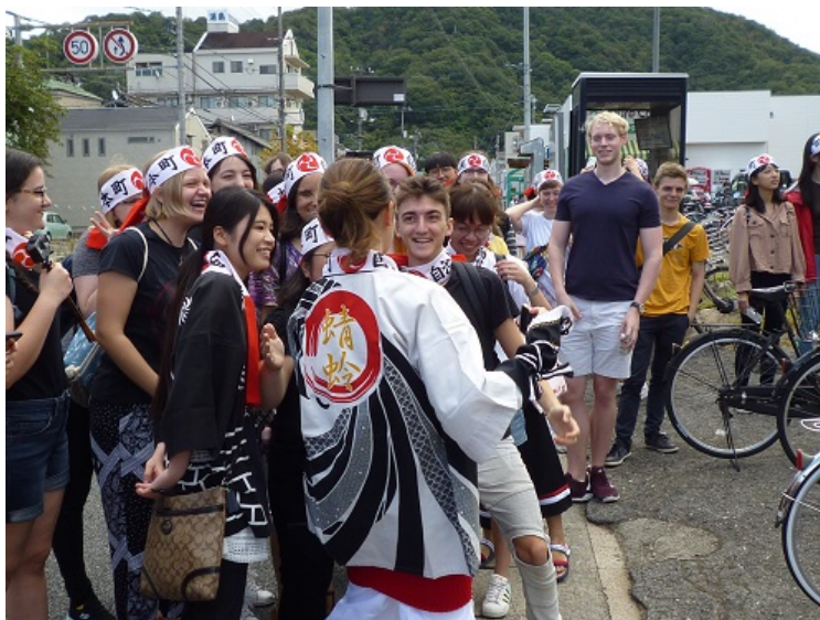
地域の人々と交流する留学生