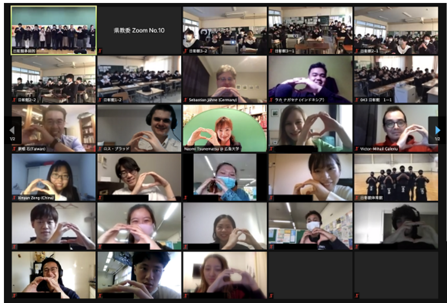
"吉舍款待计划"交流会 纪念照

200名高中生, 以及280名来自吉舍初中、吉舍小学、八幡小学的学生和当地的寄宿家庭成员对留学生表示热烈欢迎, 促成了这次大规模的国际交流会。书法、剑道和鼓乐表演给外国学生留下了深刻的印象。在国际交流会上, 参加“全球在地化实习”课程的留学生为大家带来了日语演讲和日语短剧。日英双语的主持拉近了留学生与当地居民之间的距离, 促成了一次全新的跨文化体验。留学生表示, 他们受到了当地居民的热烈欢迎, 再一次肯定了自己来日本留学的梦想, 也收获了满满的感动。