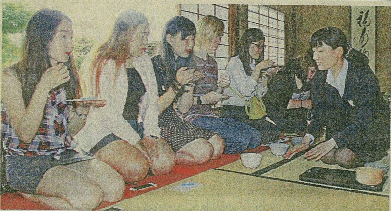
白雪楼でお茶と茶菓子を味わう留学生たち