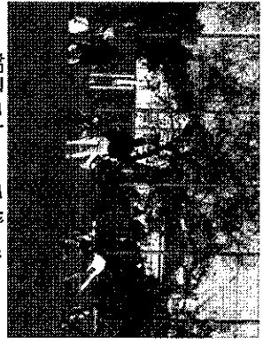
親子でキャッチボール

東京学芸大学と読売巨人軍ジャイアンツアカデミーは、10月20日に宇雲天野球場で連携講座「親子野球教室」を開催した。この講座は、平成21年度から毎年実施しているもので、今年度は58歳から小学校2年生までの子どもと保護者58組116名が参加した。参加親子はアカデミーコーチの指導のもと、打つ・守る・投げるの基本動作を一通り練習した。講座の最後には子どもだけのミニゲームも行われた。参加者からは「楽しく過ぎ、いい経験になった」「上達へのモチベーションを教えてもらえてよかった」「まだ参加したい」などの感想が寄せられた。コーチと参加親子ら