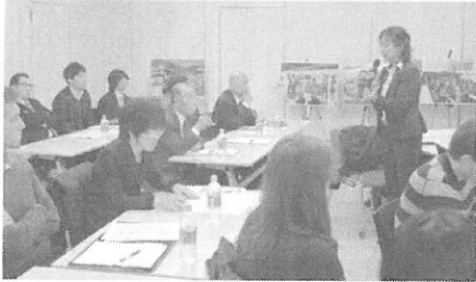
地域の参加者からのフィードバック

現在、インタラクティブな手法による子どもへの異文化紹介、各国のお祝い行事の紹介、音楽を通じた英語教育など留学生の創造力と実践力を十分に活用した実践プロジェクトが進行しつつある。発表会の成果が、実践プロジェクトにさらなる飛躍をもたらすことが期待されている。