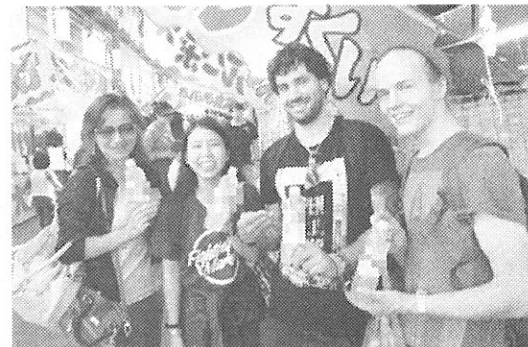
伝統的祭りの雰囲気を経験する留学生 呼ばれる「ちようさい」と 「みこし」 漁師さん のお船を かつかいで 行き来す 地域の 方々の一 生懸命な 姿に、留 学生も感 動した様 子であつ

五穀豊穡と豊漁を願い、各地区から出される神輿やお船が神社に向かい、鬼や「ばくろう」(馬喰・馬・牛の仲買人)が竹棒をもって道を作っていく様子に、留学生は見入っていた。また「そりゃさげた」の掛け声とともに、「ちようさい」と